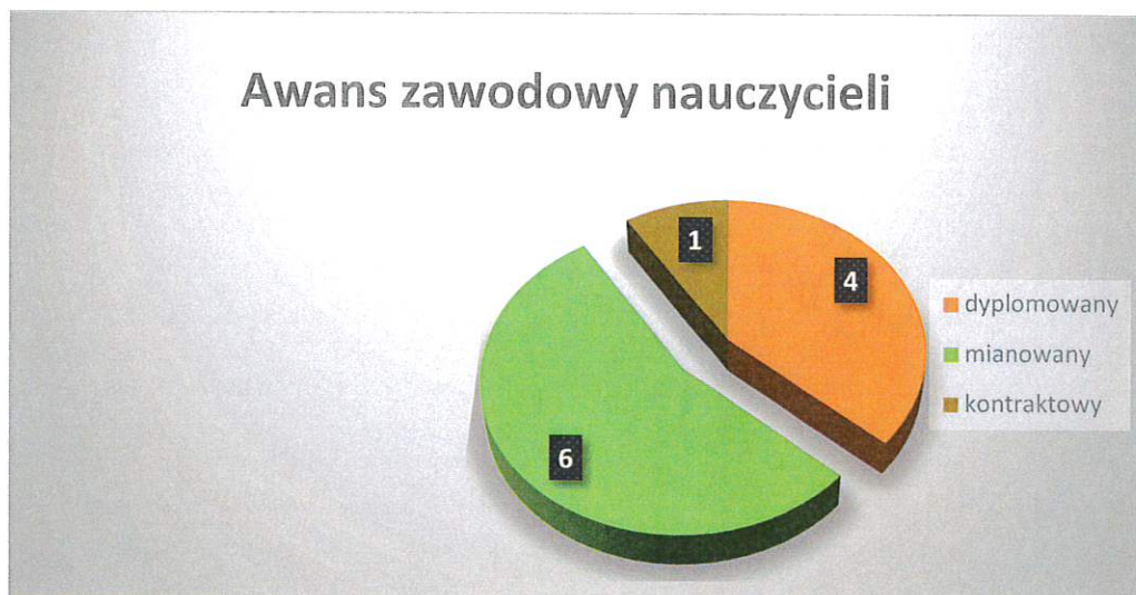
Awans zawodowy nauczycieli

Obecnie w Samorządowym Przedszkolu w Radzanowie jest zatrudnionych 11 nauczycieli w tym jeden dyrektor. Jeden nauczyciel przebywa na urlopie dla poratowania zdrowia. Wszyscy są zatrudnieni w pełnym wymiarze godzin zgodnie z posiadanymi kwalifikacjami. Jeden nauczyciel jest zatrudniony w wymiarze 2/22 (religia). W okresie wakacji jeden nauczyciel uzyskał stopień awansu zawodowego nauczyciela mianowanego. Cały czas problemem jest zatrudnienie psychologa (vacat). W strukturze zatrudnienia przedszkole zapewnia pomoc logopedy, pedagoga specjalnego, nauczyciela wspomagającego oraz pedagoga z zakresu terapii pedagogicznej. Wszyscy nauczyciele na bieżąco uczestniczą w szkoleniach zgodnych z potrzebami przedszkola. Niestety nikt nie podejmuje studiów podyplomowych oraz tych, które nadają dodatkowe kwalifikacje (potrzeby związane głównie z pomocą psychologiczno – pedagogiczną, oraz zarządzaniem oświatą).